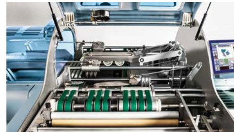
Elevata accessibilità interna.