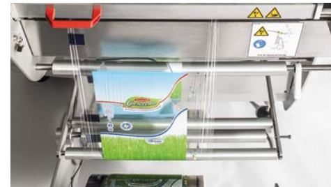
Inserimento film stampato.