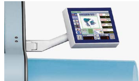
Monitor con interfaccia di facile utilizzo.