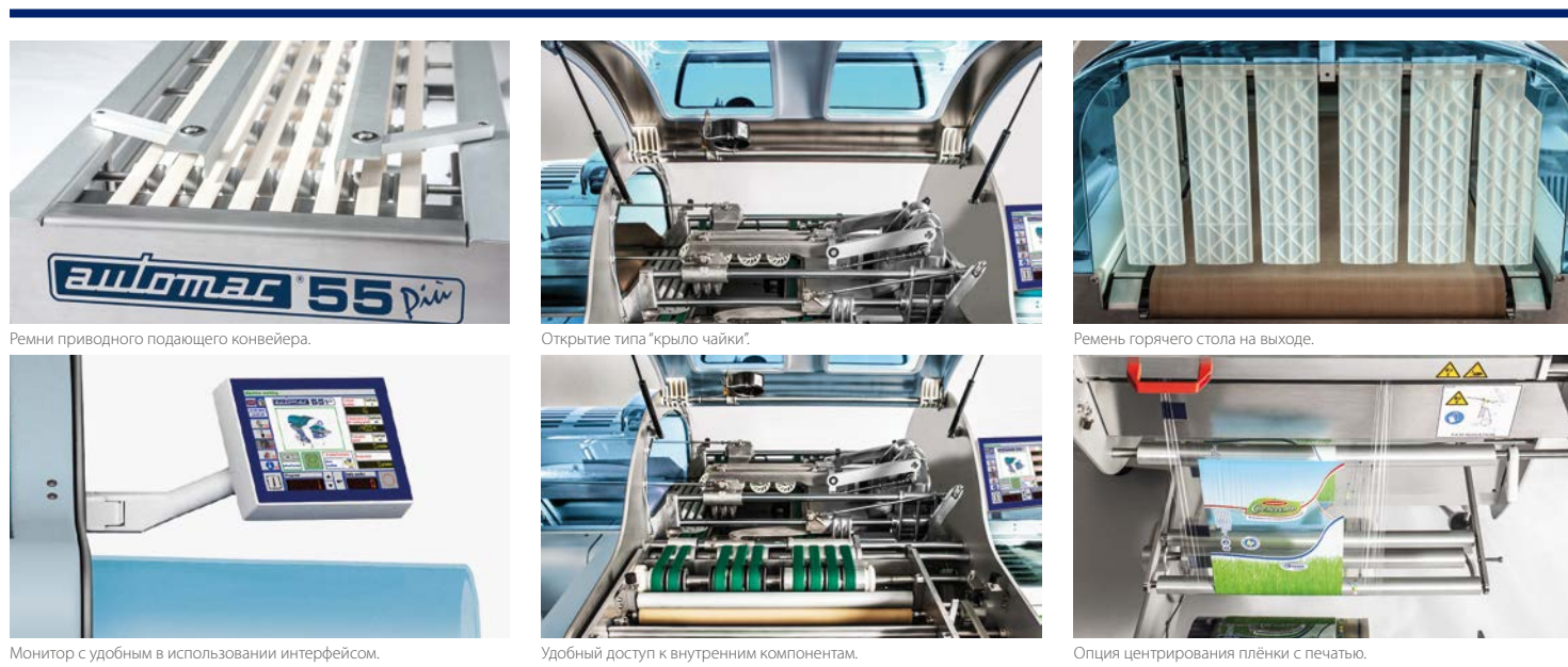
Ремень приводного подающего конвейера.