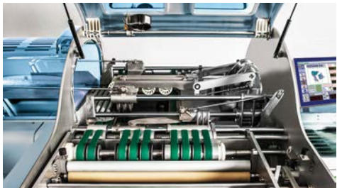
Удобный доступ к внутренним компонентам.