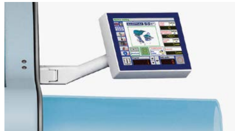
Монитор с удобным в использовании интерфейсом.